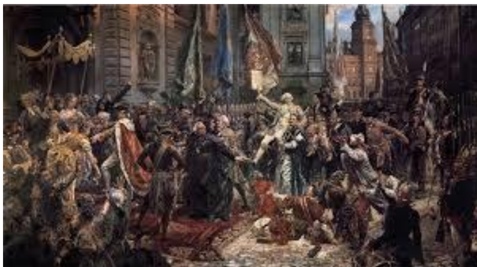
Konstytucja 3 Maja 1791 roku, Jan Matejko